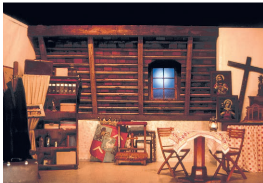
Verschiedenste Accessoires und Antiquitäten werden zu einem harmonischen Ganzen