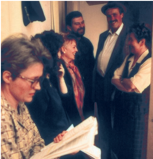
Die Spieler warten hinter der Bühne auf Ihren nächsten Auftritt

Bei der Auswahl der Stücke wurde immer auf Abwechslung geachtet. So wurden Stücke von verschiedenen Autoren, Verlagen und Themen gespielt und neben der Verkündigung sollte auch das Lachen nicht zu kurz kommen.