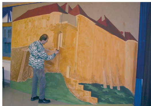
Das historische Vorbild von Schloss Albrechtsberg dient 2004 als Ausgangspunkt für die Bühnengestaltung – selbstverständlich in Anpassung auf das inszenierte Stück.