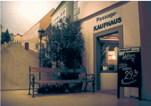
Das Bühnenbild (1990) verlagert die Handlung des Stückes nach Loosdorf (Wachaustraße).