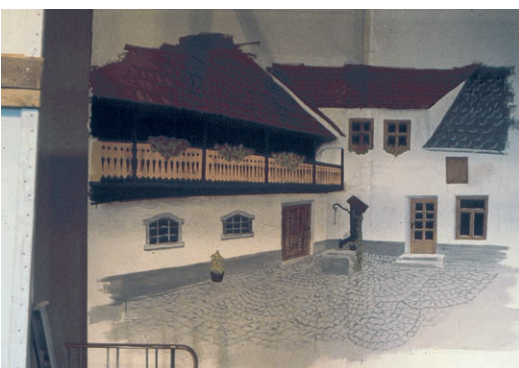
Unzählige Male bewegt sich der Farbpinsel jedes Jahr über die Oberfläche von Bühne und Requisiten um im Jahr darauf alles erneut zu adaptieren und zu färbeln ...