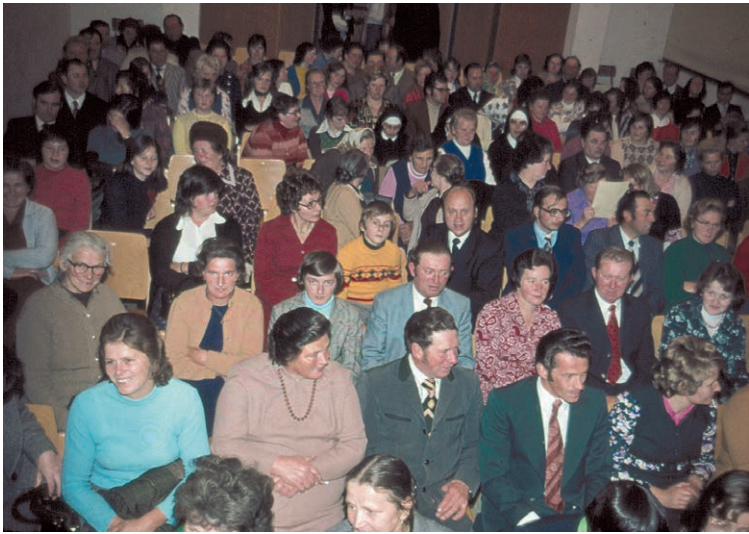
Achtmal wurde „Zaida“ aufgeführt – jedesmal in einem gefüllten Theatersaal.

Von dem großen Erfolg von Zaida motiviert, wurde nun die Pfarrbühne Loosdorf gegründet, die 1978 die nächsten Aufführungen darbot. Die Pfarrbühne wollte so an der Verkündigung mitarbeiten. Gespielt wurden zwei Einakter von Leo Tolstoi: „Wo die Liebe ist, da ist auch Gott“ und „Gott sieht die Wahrheit“. Tolstoi, ein russischer Graf, will mit seinen Stücken zu einem einfachen Leben im Sinne des Evangeliums aufrufen. Der erzielte Reingewinn wurde pfarrlichen Anliegen zur Verfügung gestellt.