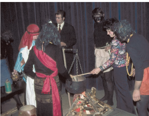
Bühnenumbau 1975 während einer Pause.

Zu ihren Ehren wurde eine Festwoche veranstaltet, bei der auch das von ihr geschriebene Theaterstück „Zaida, das Negermädchen“, aufgeführt wurde. Es wurden Darsteller gesucht – Erwachsene aus der ehemaligen katholischen Jugend, junge Menschen und viele Kinder. Es war damals für die Gruppe eine große Herausforderung, ein Stück über einen fremden Erdteil, über fremde Menschen – Schwarze und Araber – und deren Probleme glaubhaft auf der Bühne in Szene zu setzen. Achtmal konnte das Stück vor vollem Haus aufgeführt werden.