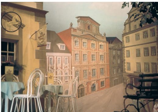
Die Häuserfront von 1991 (Bild oben) wird ein Jahr später (Bild rechts) zum unscheinbaren, aber wichtigen Detail im Hintergrund.