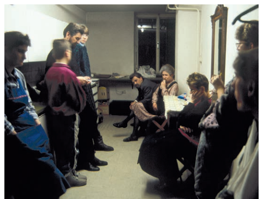
Die eigentliche „Küche“ des alten Pfarrsaales unter der Bühne wurde aus Platzgründen zweckentfremdet als Garderobe und Aufenthaltsraum der Schauspieler genutzt.